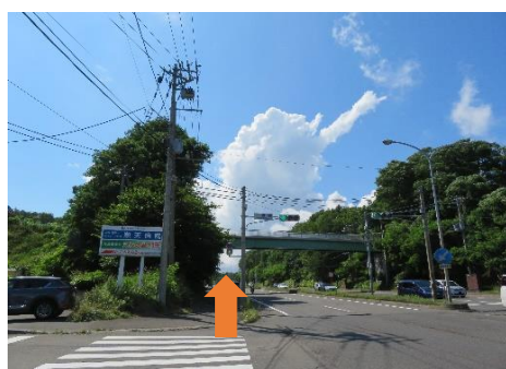
5、二つ目の信号も渡り直進する。