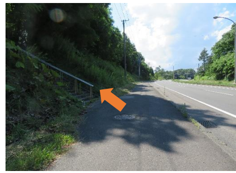
6、途中左手に出てくる上野幌神社の階段を利用すると近道。