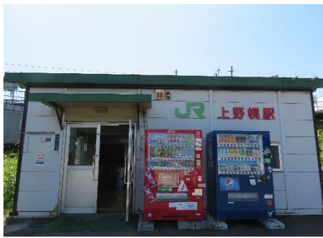
1、上野幌駅、千歳線札幌駅から5つ目で下車。