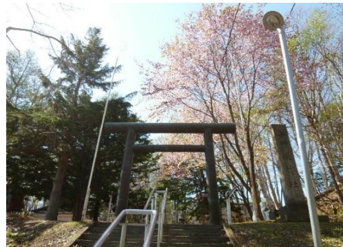
8、鳥居を過ぎると右上に法人が見えてくる。