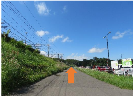
2、駅を出て左手線路沿いを国道274号線に向かって進む。