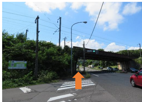
4、信号を渡り札幌方面へ進む。