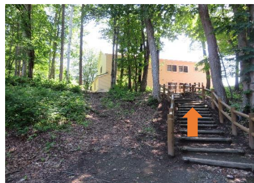
9、最後の階段を進む。