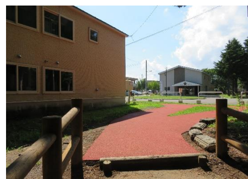
10、駅から11分ほどで到着。