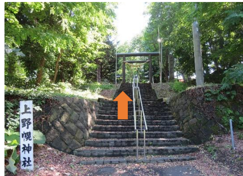
7、神社まで続く階段を進む。